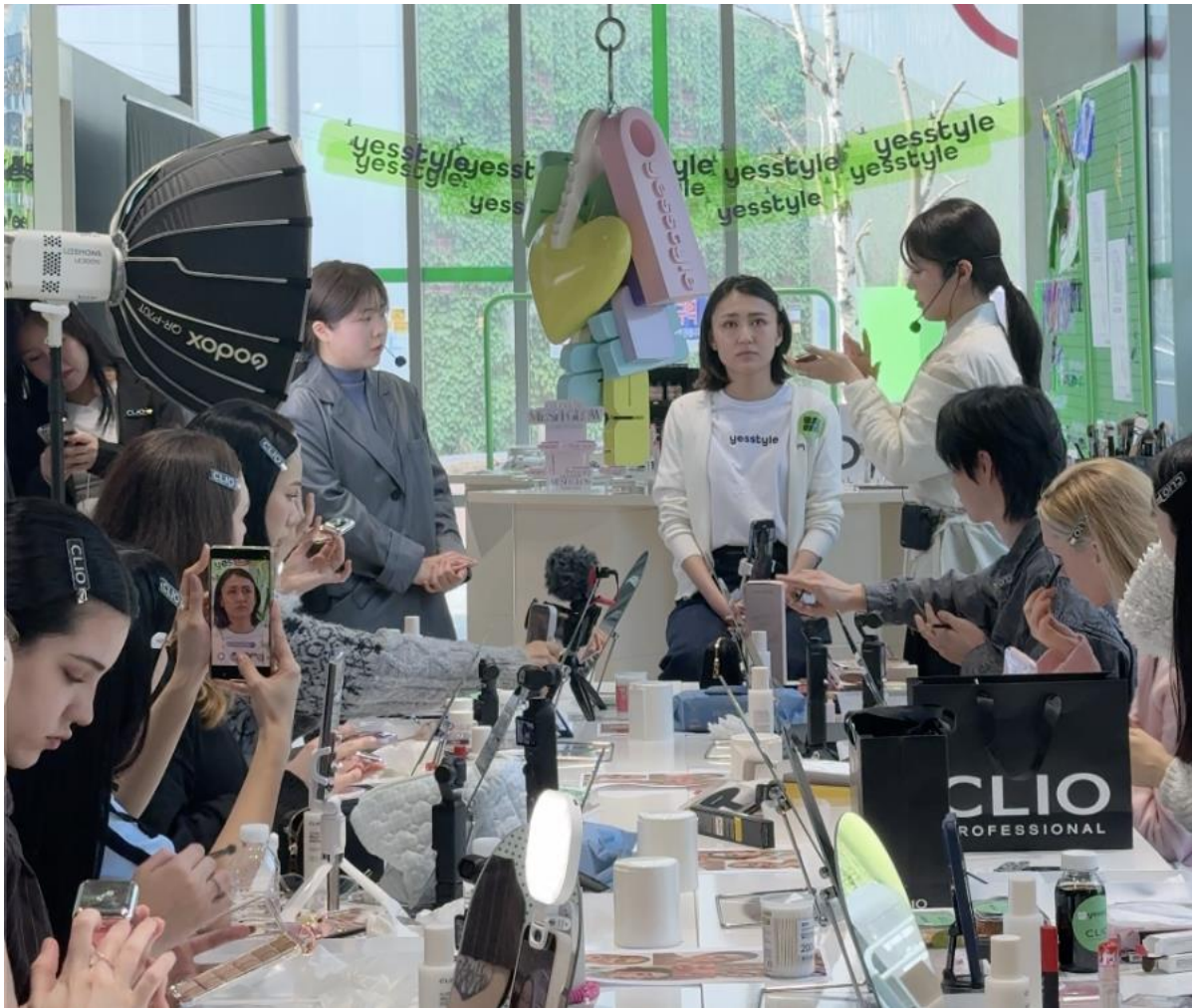
YesStyle 與 CLIO 的美妝大師課上，KOL 與意見領袖們共度實踐美妝探索的一天。